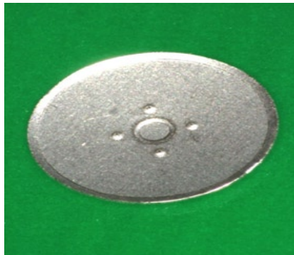
写真1 オリジナルクリックドーム外観